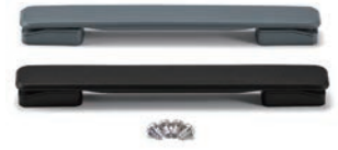
エラストマ取手 FM200シリーズ P13-17