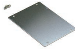
シャーシ UCCシリーズ P8-15