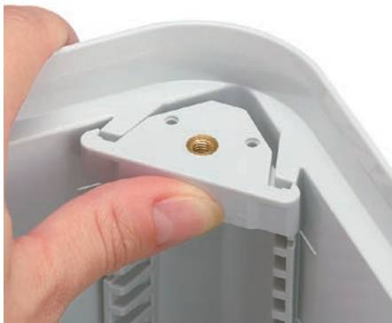
UEL-1を使用した操作パネル例