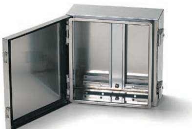
型番・寸法・標準価格