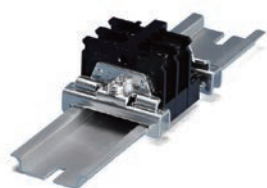
DINレール止め金具 TKRシリーズ P13-28