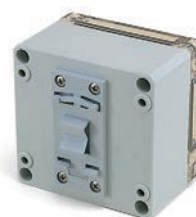
ネジ止め式DINレール取付足 DRT-1シリーズ P13-27