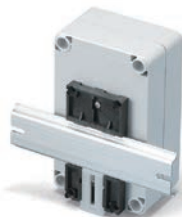
DINレール取付板 DRAシリーズ P13-27